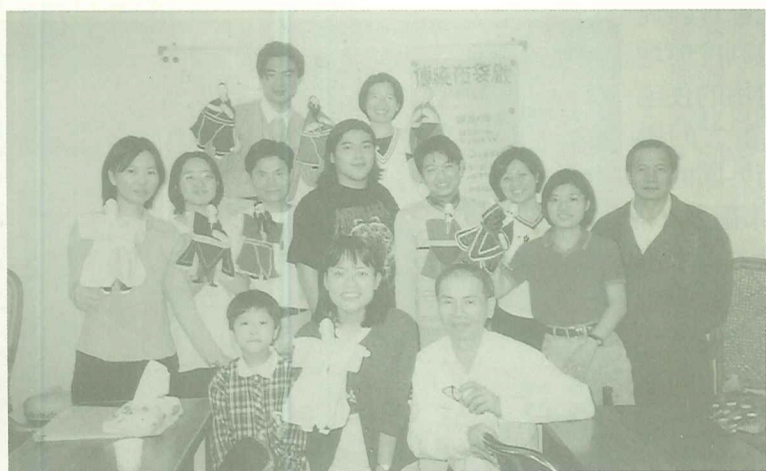
初次操作布袋戲偶的學員們，對揣摩人物的動作表情，感到新鮮有趣

「入門」很簡單嗎？能學到什麼，大概只是講講戲曲歷史，看看老師表演齣精采的布袋戲吧？但上了兩天「滿滿的」十二小時課程後，才發覺「入門」其實並不簡單——雖然我操作的木偶仍是笨拙呆板；雖然我唱的古樂譜仍是五音不全；雖然後場演奏時我的鑼還是會出奇不意的亂響；甚至就連基本的請出一仙仔，頭也是歪歪斜斜，好像大病初癒。別說能學到像老師那樣，