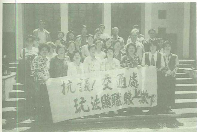
竹圍民眾去年4月組團抗議交通處興建淡水環河快速道路。

而更令人振奮的是，台北縣政府靜極思動，針對淡水河北側快速道路計畫路線可能影響淡水鼻仔頭迺生洋行歷史建築、台灣第一座水上機場、氣象側候所（含側候所遺址）及紅毛城下清代海關碼頭等古蹟，於八十七年五月廿一日先已做過初步履勘，在八十八年元月八日復進一步邀請文化大學李乾朗教授、台灣科大徐福全教授及中國工商張震鐘教授等專家學者到現場實地會勘。據李乾朗教授會勘後表示，迺生洋行這四棟歷史建築，十分珍貴，不僅見證了淡水港口的歷史，也是台灣海上貿易史上的重要文化資產；至於海關碼頭，經現場會勘應屬清代所建的火輪汽船碼頭，有可能是台灣早期港埠中，目前唯一僅存的十九世紀官式碼頭，極具保存價值。縣政府已準備在會勘意見彙整後，擴大邀請學者專家參與審查，審慎評估指定古蹟的必要性。一旦通過指定古蹟，環快路線勢必非做調整不可，讓各方高度注意與期待。