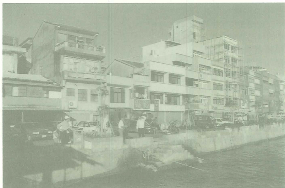
九〇年代的淡水河岸，倘若再加上一條2米高的環河快速道路淡水河岸前令人堪憂。

註：本篇在前段古蹟部份的介紹採用的資料是由淡水社區工作室所寫的〈淡水「鼻仔頭」街附近古蹟指定會勘補充資料〉及由紀榮達先生寫的〈中法戰爭古戰場〉及〈淡水海關碼頭〉兩份提報為古蹟的文件節錄及現場會勘口述彙整而成。