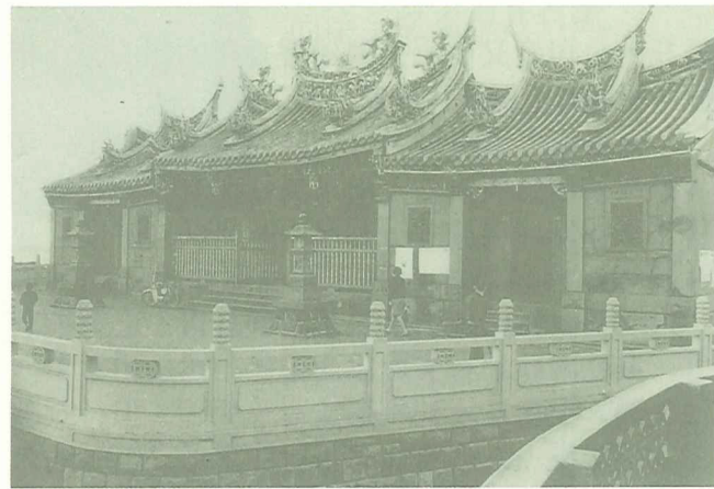
民國50年代的清水巖祖師廟

淡水的街市發展，與廟宇有著密切關係。清文里內著名的廟宇，首推清水巖祖師廟。清水祖師廟建於日治昭和12年（西元1937年）。祖師廟獨據高地、俯瞰淡水小鎮，地理位置十分優越。